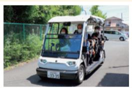
グリーンスローモビリティ