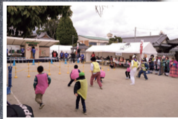
全国だるまさんがころんだ選手権大会