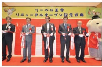
リーベル王寺リニューアル記念式典