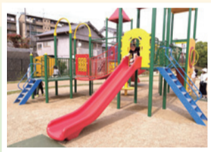
いずみパークの遊具