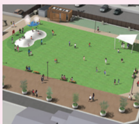
王寺町中央公民館跡地整備イメージ