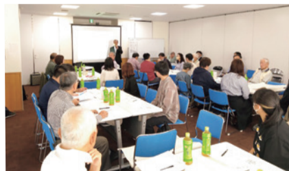
まちづくり協議会設立に向けた町民ワークショップ