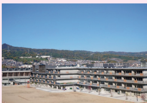
令和4年4月に開校した王寺北義務教育学校